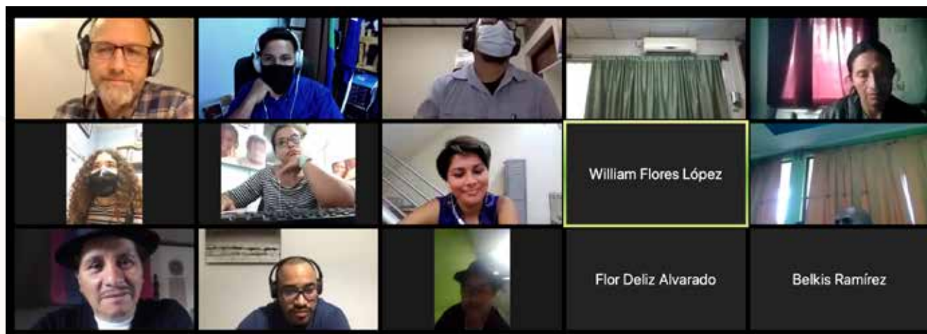
Diálogo intercultural sobre el paradigma investigativo del CCRISAC.